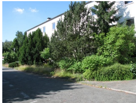
Verwilderungen vor KpGeb. PzJgKp 110