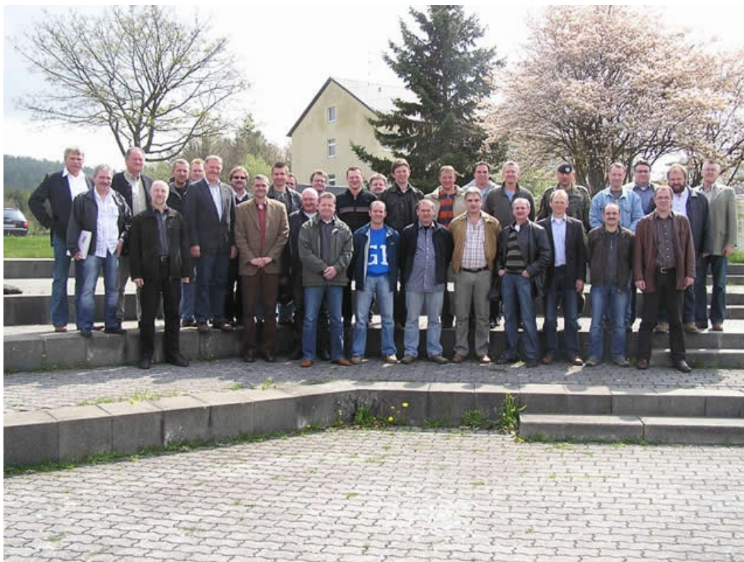
Gesamtbild der Ehemaligenkameradschaft der PzJgKp 110, Neunburg vorm Wald

Bei Kaffee und Kuchen und vielen Geschichten aus der guten alten Panzerjägerzeit klang das 2. Treffen der 110er aus. Es war ein toller und erlebnisreicher Tag!