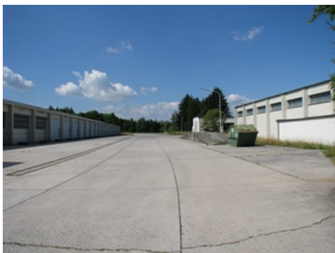
ehemaliger T-Bereich der PzJgKp 110