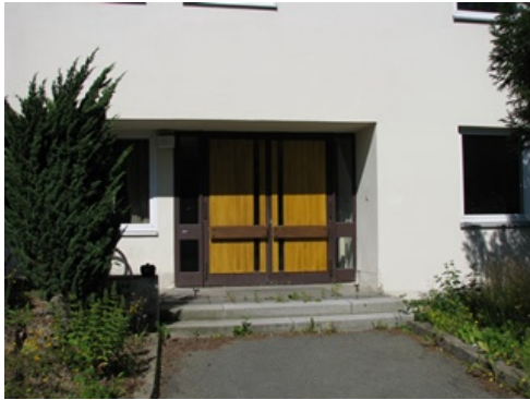
ehemaliger Eingangsbereich PzJgKp 110

Am 05.07.2008 war ich mit der Kamera in der ehemaligen Pfalzgraf-Johann-Kaserne unterwegs. Die Spuren nach der Schließung sind deutlich zu sehen!