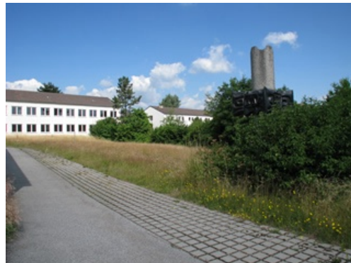
Blick vom Mannschaftsspeisesaal